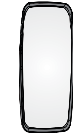
Espelho Retrovisor W912 - Convexo - LD / LE W918 - Plano - LD / LE