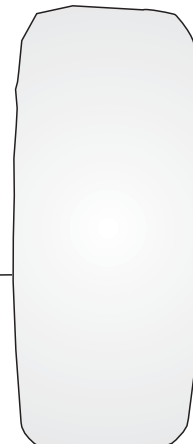
Vidro Espelho Inteiriço D720W - Convexo D721P - Plano

As marcas mencionadas neste catálogo e as imagens reproduzidas, são de propriedade dos respectivos fabricantes e aqui são utilizadas apenas para indicar a aplicabilidade ou destinação dos produtos fabricados pela Bepo, atendendo ao preceito contido no Art. 132 da lei 9279/96.